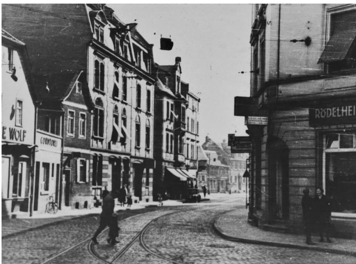
Historische Aufnahme der Straße Alt-Rödelheim (Nr. 38 ist das dritte Haus links).